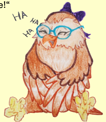
Pripravila: Tami Schmidtová

„Keď nepríde Mohamed k hore, zostane doma.“ „Hádzať perly o stenu.“ „Hovoriť striebro, myslieť blato!“ „Kto klope, nemá kľúče!“